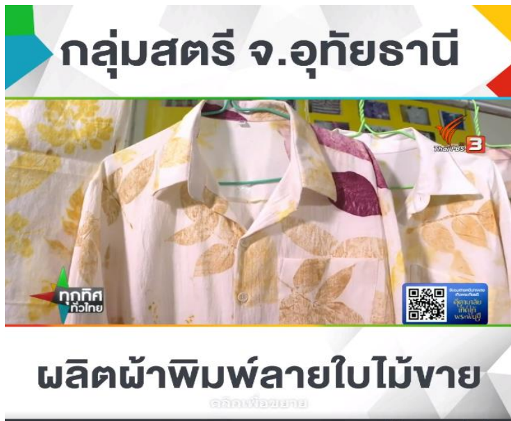
ภาพกิจกรรมการติดตามผลกิจกรรมและสร้างเครือข่ายโดยความร่วมมือกับจังหวัด อุทัยธานี